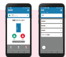
ホーム画面 設定画面

スマートフォンから家族のキーの登録・ 各種設定、施錠履歴を確認すること ができます。